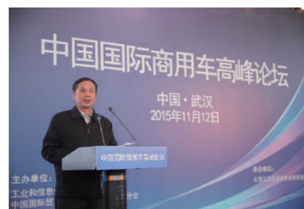
中国国際商用車サミット