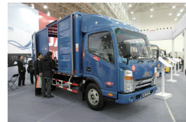
江淮汽車の物流車両