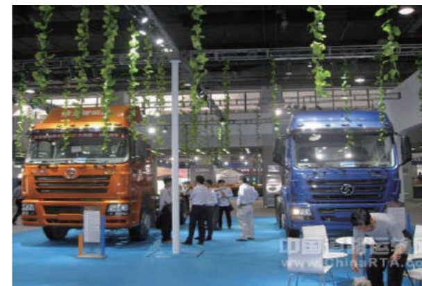
陝西重汽の展示場面