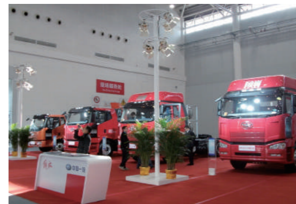
中国一気の展示車両