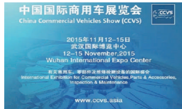
展示会のポスター

国工業報、中国交通報、現代物流報、第一財經報、湖北日報、長江日報、中央テレビ、湖北テレビ、武漢テレビ、広東テレビ等50社あまりの報道関係が集まり大盛況となった。