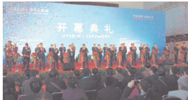
開会式のセレモニー

2015年11月12日から15日の日程で中国・武漢で開催された「中国国際商用車展示会」は、国内外からビッグなシャシーメーカー、バス、商用車、専用車、及び部品会社が出展し、国内外の完成車及び部品メンテナンスの集大成となった。