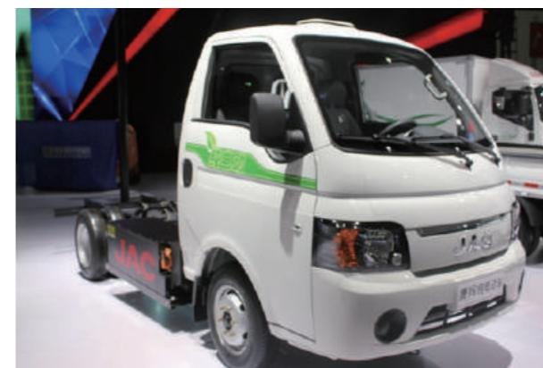
江淮康鈴 純電気トラック