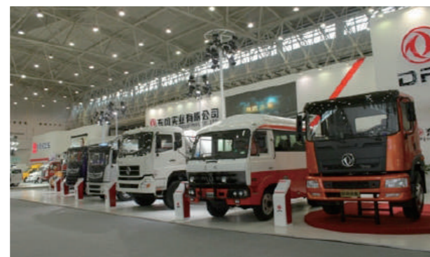
東風商用車有限公司の展示車両