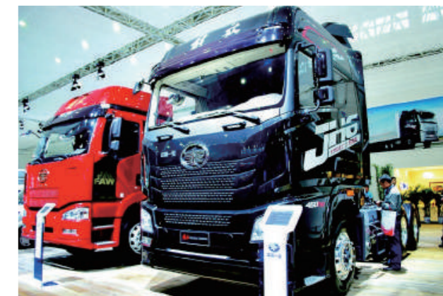
中国一気の展示車両 「解放」というブランドです