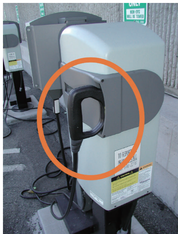
GM が採用していた充電方式のインダクティブ・チャージャー