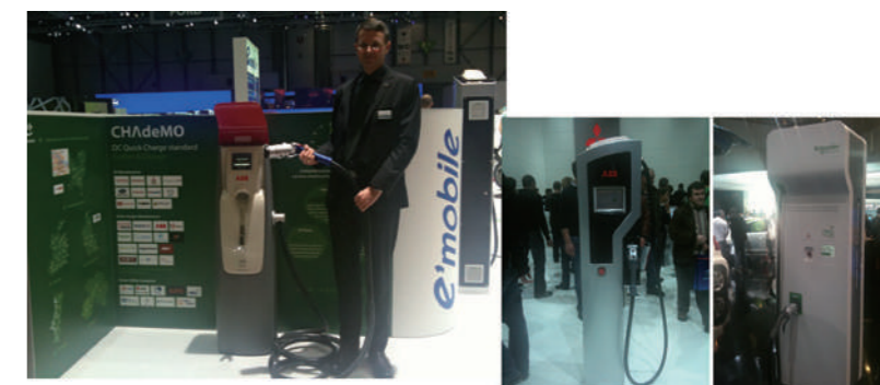
ジュネーブモーターショーでのCHAdeMO対応充電器の展示(2011年3月)

最終的には、ドイツの面子も立てる必要があるため、ドイツ製COMBO規格さえ搭載されていれば、それに加えてCHAdeMO規格が搭載されていても構わないというルールで決着することができました。