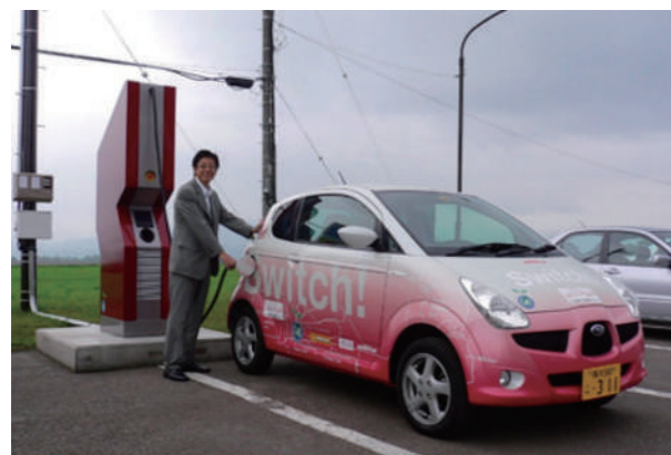
洞爺湖サミットでの R1e と急速充電器(2008年7月)