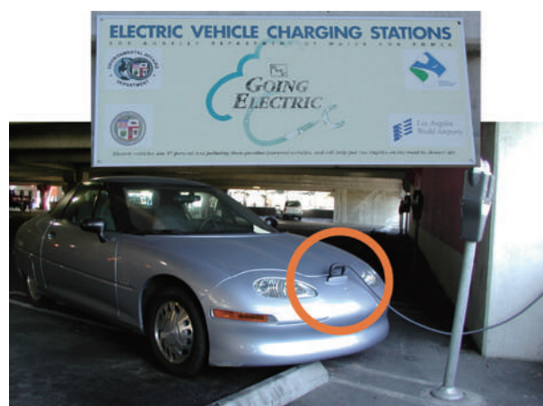
充電中の GM の EV1

た。当時のカリフォルニア州には充電ステーションが 100 か所以上ありましたが、実は充電規格がばらばらでした。