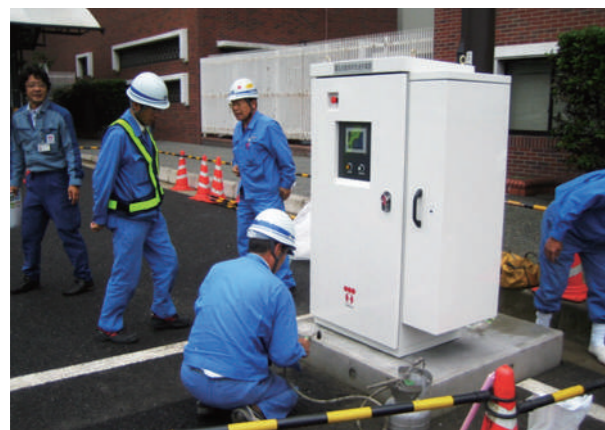
最初に導入された急速充電器(2008年10月)