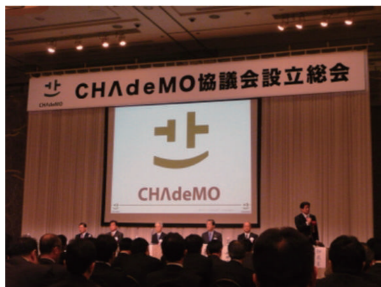
2010年3月 CHAdeMO 協議会設立

今では世界中に約1万7000台の充電器が設置されており、その数はまだ増えています。