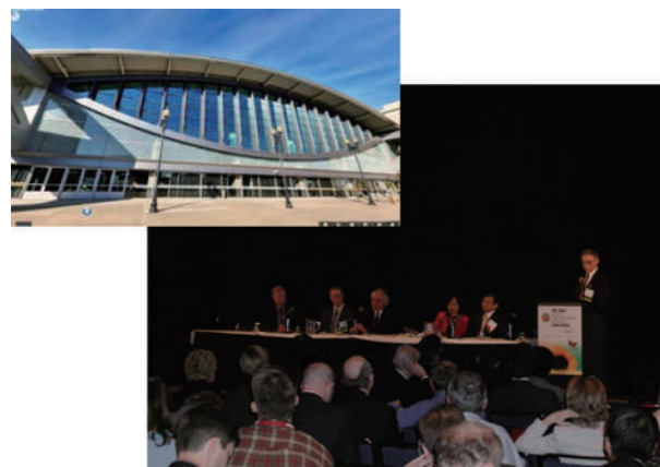
参加した電気自動車のシンポジウム(2001年 カリフォルニア州サクラメント)