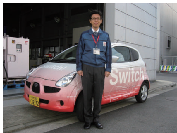
スバルが開発していた電気自動車 R1e (2006年11月)