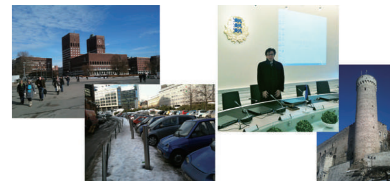
CHAdeMO方式の普及啓発活動(左 ノルウェー・オスロ、右 エストニア・タリン)

大変嬉しいことに、今でも欧州の充電器メーカーの人たちには感謝してもらっています。CHAdeMOのメンバーが現地まで赴き、製造ラインの組み方まで指導したものですから。