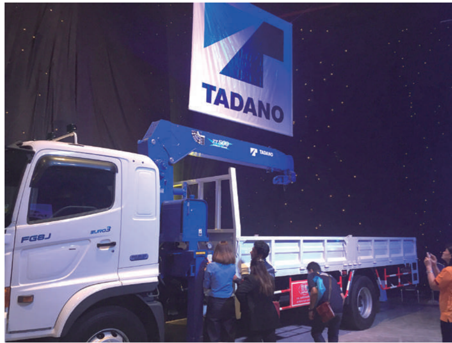
展示された実機での説明を受ける来場者。この「TM-ZT500」シリーズが今回のメイン