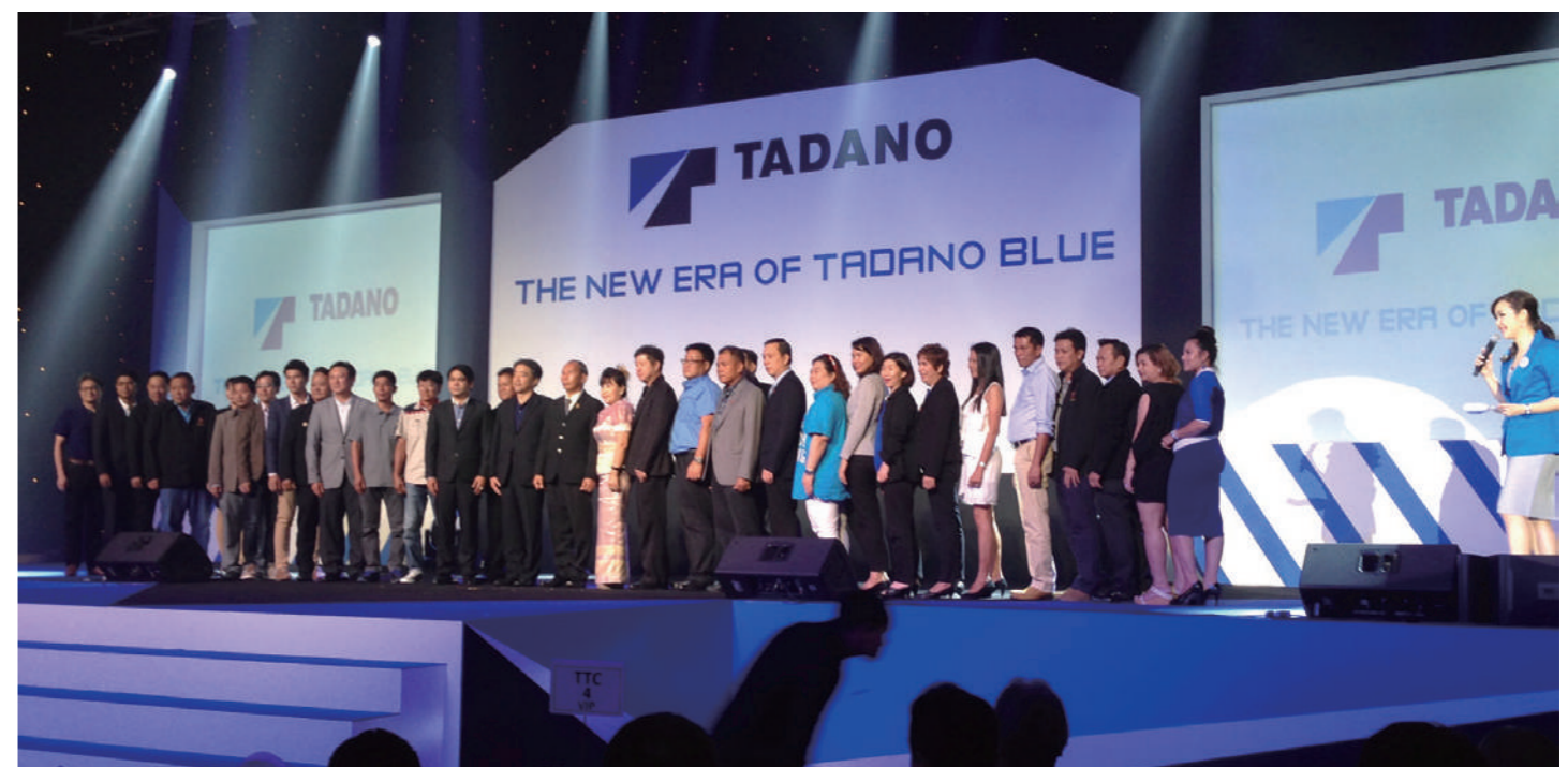
来賓をステージに集めての記念撮影会。タイのクレーン協会会長の顔も見える。発表会での撮影会はタイでは定番となっている