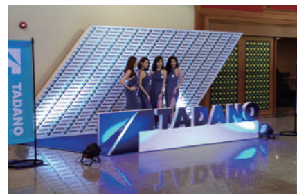
会場を入るとタダノガールたちが出迎えてくれる