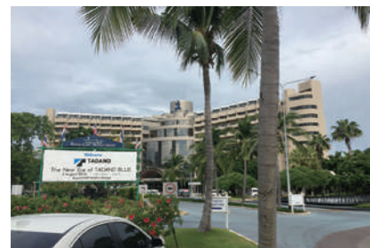
発表会場となったパタヤのコンベンションホール

発表された両機種とも TTC が製造販売するカーゴクレーンで、中型車用の ZT500 シリーズはすでに販売が開始されているが、大型トラック用の ZT1000