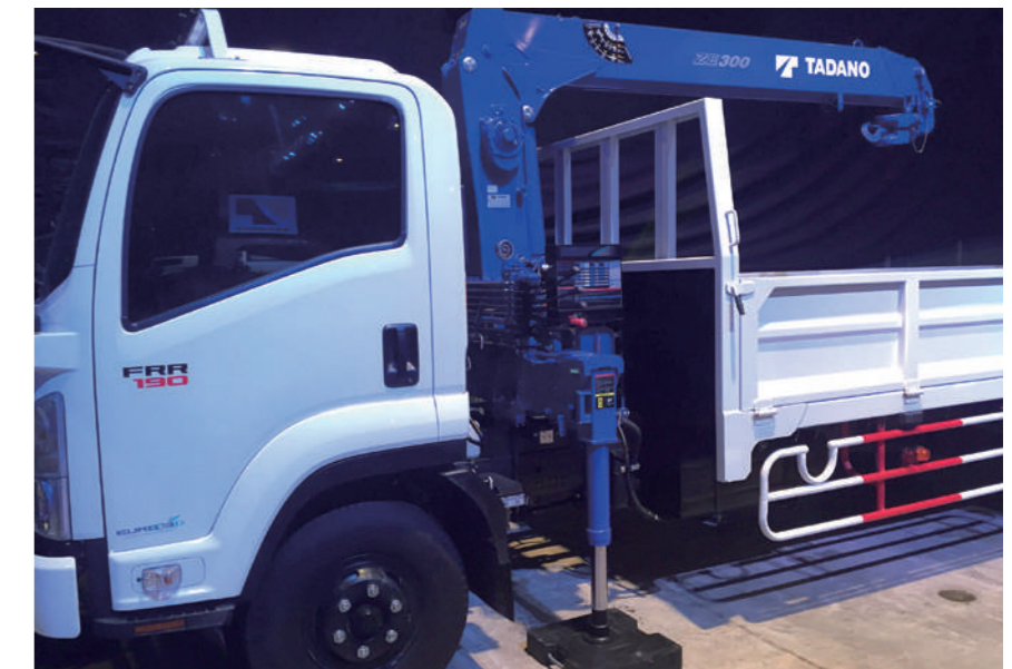
カーゴクレーンとして汎用性の高い 2.93 t 吊りの「ZE300」も展示されていた