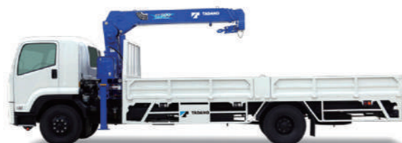
高機能を搭載した新型「TM-ZT500」