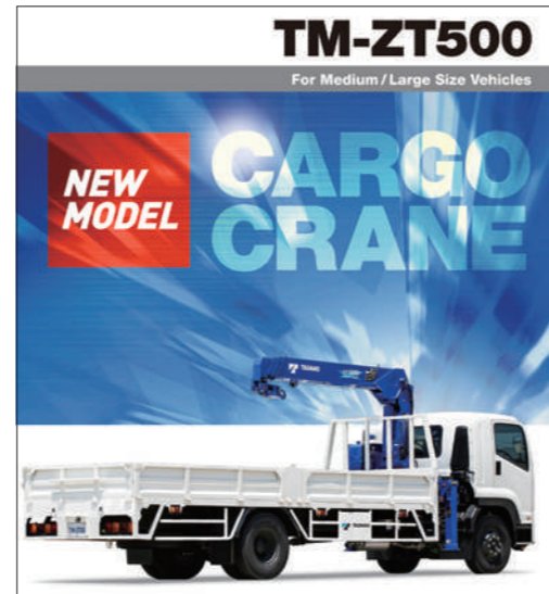
「TM-ZT500」の製品カタログ表紙