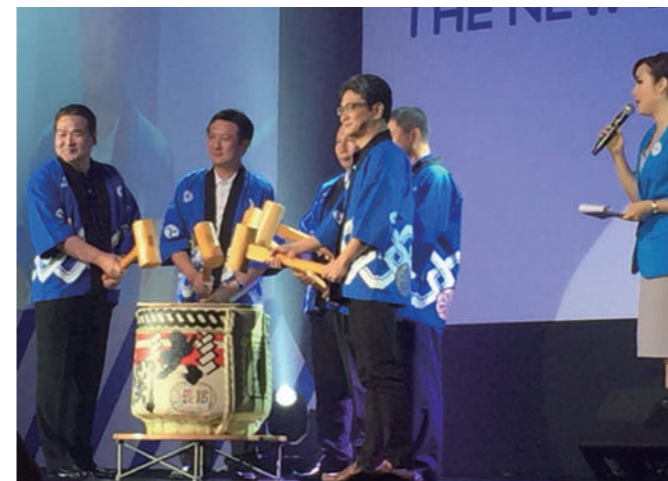
日本スタイルの鏡割りでの乾杯。タイではこういう演出がうける