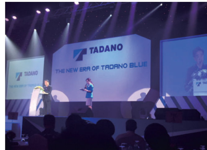
ステージでは TTC 吉田社長や本社海外担当役員が挨拶を行った