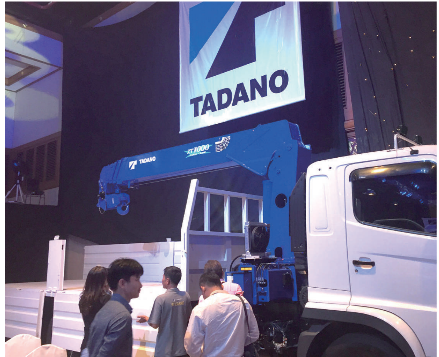
今後発売が予定されている 10 t 吊り「TM-ZT1000」シリーズ。中・大型車用に搭載される機種でこの高能力は建設作業などに威力を発揮するタイプになる