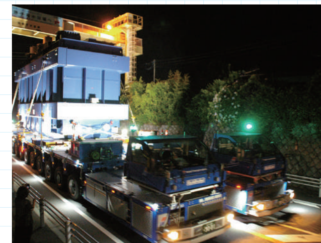
あの歩道橋も無事通過。「今夜の主役」はなお日立港区第四埠頭へ向かって微速運行を続ける。通過後、歩道橋は素早く元の通常の高さに降ろされる