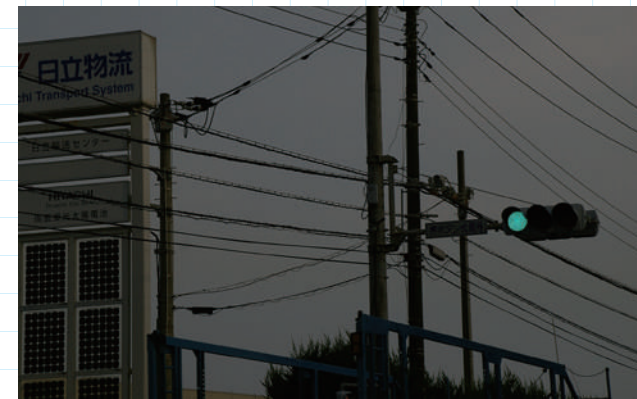
輸送準備作業は通過貨物と干渉の恐れのある道路施設に及ぶ。通常通行車両に正対する信号機はその対象の一つ。一般の場合とは異なり、回転式のブラケットを介して電柱に取り付けられている。軸部のピンを抜き90度回転させて信号機は車両の進行方向と並行になり超大貨物の干渉を回避する。この作業は道路が閉鎖されてから実際に貨物が通過する迄の短時間に行われる

一つ目は、信号機の干渉回避策だ。普段は通行車両の前面に正対している信号機は、ここでは写真に示すように進行方向と並行に90度回転させることが可能な構造になっている。二つ目は、大型の道路標識だ。これも信号機と同様に干渉の可能性があるから、今夜の主役、通過直前に取り外しておく。三つ目は横断歩道橋だ。建築限界上は最下部が通常路面から4.7mだが「日立街道」の歩道橋は2カ所あって、電動ウィンチで平時の状態から4m以上巻き上げられる構造になっている。昇開式歩道橋と呼ばれる。因みにウィキペディアで「歩道橋」を検索すると写真の日立市河原子歩道橋が昇開式歩道橋の例として掲載されている。