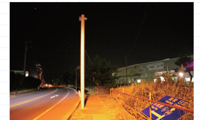
一時的に取り外されて地上に降ろされた道路標識