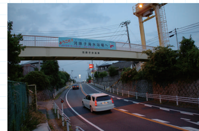
横断歩道橋も関係施設だ。一見して普通の歩道橋と違って無いが、左右の支柱が円柱でかなりの高さがある。上部に電動巻き上げ式のウィンチが搭載されており、これで通常より4mほど上部に巻き上げられる。この写真の歩道橋はウィキペディアに「昇開式歩道橋」の事例として掲載されている