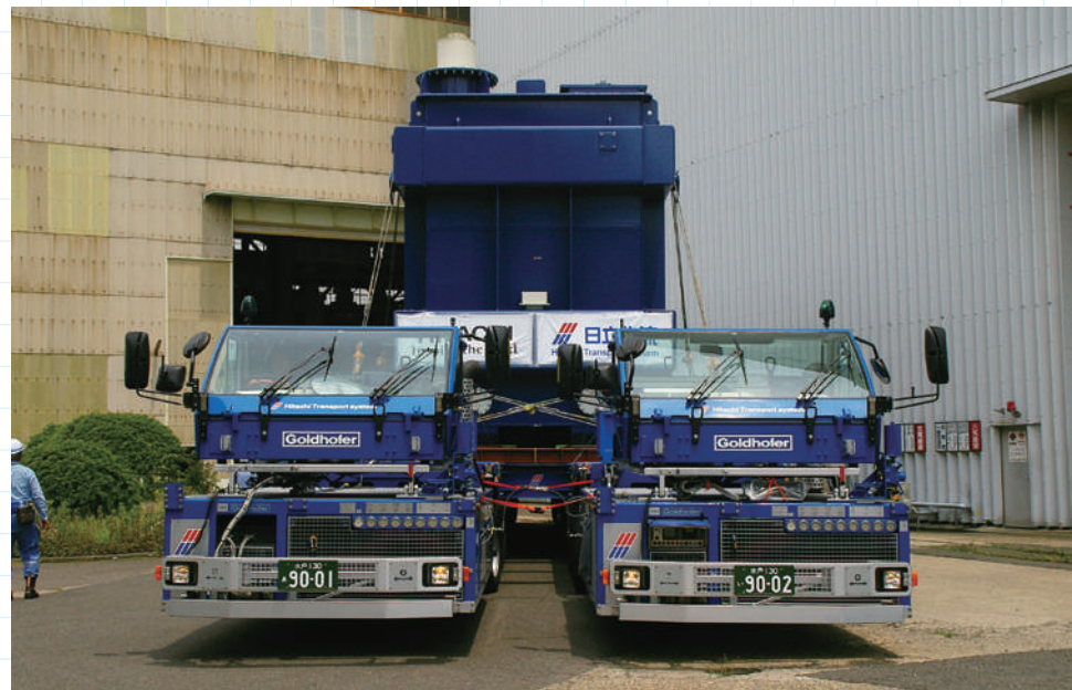
パワーモジュール(PM)上の運転室は左右に2箇所あるが、運転は片側で全ての操作が可能。PMは路面の状況により区部を支点に上下にスウィングして路面との干渉を回避する