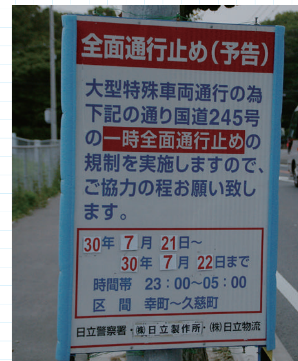
公道の閉鎖により超大貨物の輸送が行われる。実際に超大貨物が通過する町道、国道は延長約9kmだが、その前後の出入り地点のほかに接続する町道の要所の約20か所に同様の標識が立てられる。作業は全て日立物流の手による