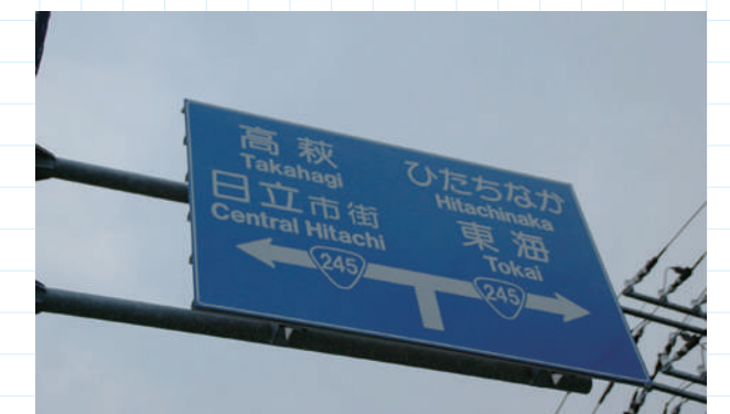
上部の道路標識も干渉の恐れがあるので回避作業の対象だ