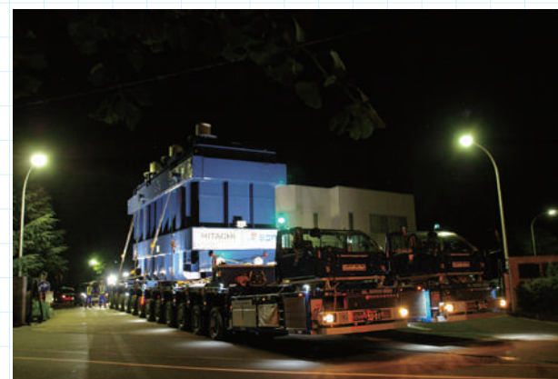
工場正門を出る今夜の主役・・・