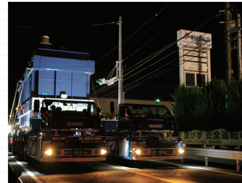
日立物流日立重電営業所前を通過する「今夜の主役」。信号機が干渉を避けて回転させてあるのが判る