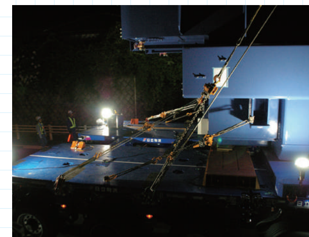
9kmの道中は傾斜(前後・左右方向)もあるから、これだけ大きな貨物で重量もかさみ重心も高いからラッシングも安全最優先で万全を期している。中間地点では10分間の休止時間をもってラッシング状況等の点検も行われた