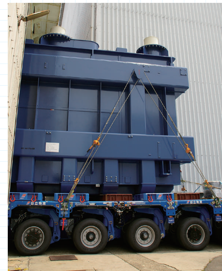
超大貨物が姿を現した!!

今回の特殊車は本誌6月号で紹介したゴールドホファ社のヘビーデューティモジュール(HDM)で、幅2.5m全長24.4m/全12軸/48輪の編成を横に2編成結合して全幅を5.75mとした状態だった(6月号記事中の俯瞰写真と同じ)。