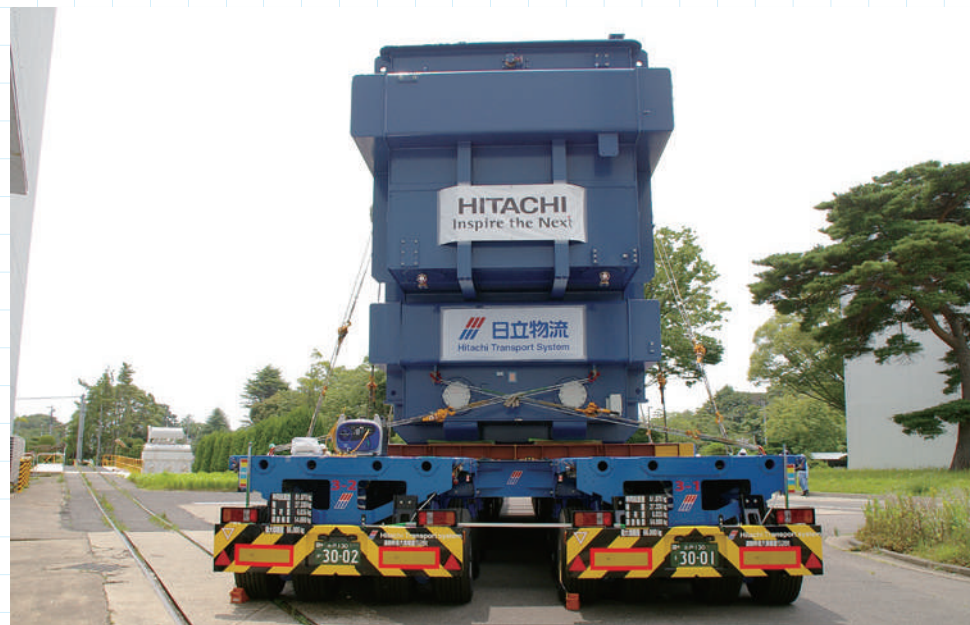
登録番号標は結合された左右の各編成に夫々付されている