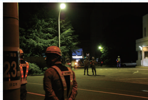
v工場敷地内でこの時まで待機していた超大貨物がライトアップされた。いよいよ深夜の輸送開始直前、関係者に緊張が走る