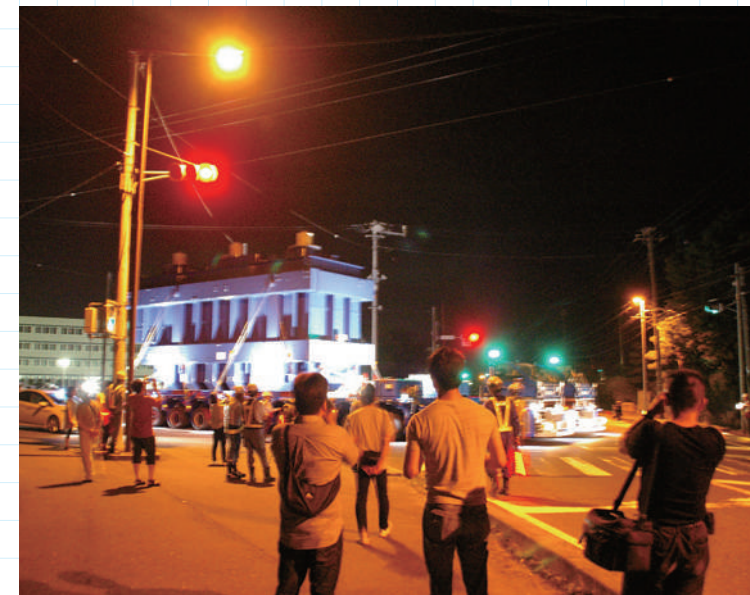
一般市民の関心も高くカメラを構える人も多い。中にこの製品の製造に関わったと思われる相当数の日立社員もいて、感慨深げに見送っていた