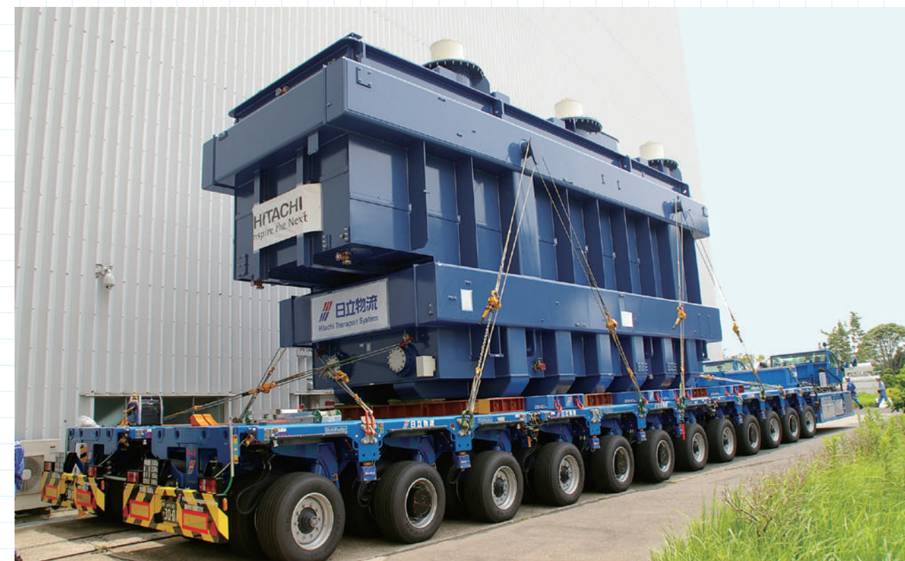
いやその大きいこと!!